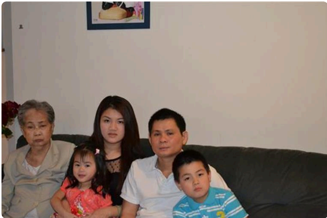
Lan cuoi cung con duoc mung tuoi me