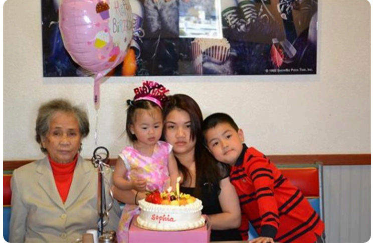
Noi va cac chau